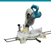
LS1040N Stabilna in kotna žaga