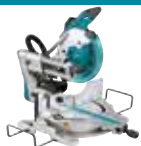
LS1019L Stabilna in kotna žaga