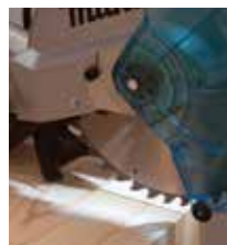
LED lučka s funkcijo rezalne linije

Razpon naklonskega kota od 47° v levo in do 2° v desno. Enostavno spreminjanje naklonskega kota od 0° do 47° v levo in od 0° do 2° v desno s preprostim pritiskom na gumb.