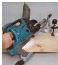
Kot žagine mize od 47° v levo in do 47° v desno

LED delovna lučka meče senco žaginega lista na obdelovanec in ustvarja natančno linijo rezanja. Če senco poravnate s črto na obdelovancu, lahko naredite natančen rez.