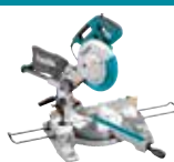
LS1018N Stabilna in kotna žaga