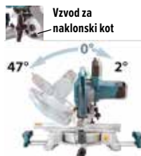
Vzvod za naklonski kot

Razpon naklonskega kota od 47° v levo in do 2° v desno. Enostavno spreminjanje naklonskega kota od 0° do 47° v levo in od 0° do 2° v desno s preprostim pritiskom na gumb.